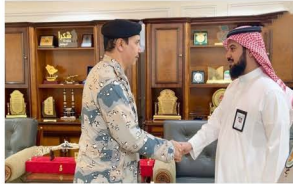
عميد الكلية د.أحمد العسيري يلتقي قائد قيادة حرس الحدود بمنطقة نجران