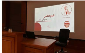
كلية طب الأسنان تنظم برنامجاً توعوياً بمرض سرطان الفم