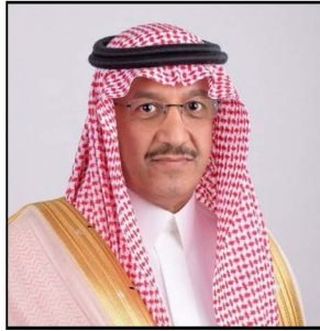
معالي وزير التعليم الأستاذ/ يوسف بن عبدالله البنيان