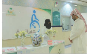
كلية طب الأسنان تقيم برنامجاً توعوياً لمرضى السكري في مستشفى الولادة والأطفال بنجران