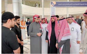
رئيس الجامعة أ.د.عبد الرحمن بن إبراهيم الخضير يحرص الحملة التوعوية التثقيمية لذوي الهمم للعام الجامعي ١٤٤٤هـ.