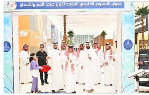
رئيس الجامعة أ.عبد الرحمن بن إبراهيم الخضير ي دشّن الأسبوع الخليجي الموحد لصحة الفم والأسنان للعام الجامعي ١٤٤٤هـ.