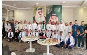
مسنوبي كلية طب الأسنان يحتفلون باليوم الوطني ٩٢