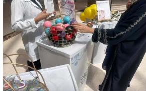
كلية طب الأسنان تنظم فعالية "فسيك تهمننا" في الكليات الصحية للطالبات